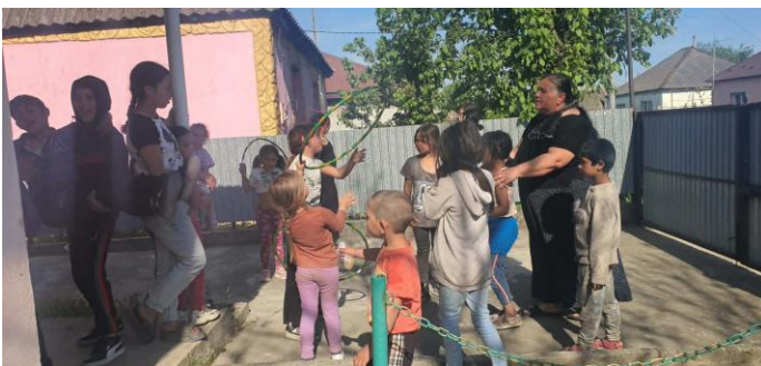
Holmokissa valmistaudutaan leikkimään pihalla.