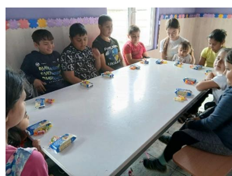
Lopuksi lapset saavat pientä välipalaa.