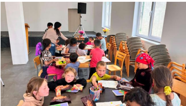
Radvankan lapset ovat jo oppineet istumaan paikoillaan ja tekemään tehtäviään.

Iloitsemme, kuinka Jumalan valtakunta menee eteenpäin, erityisesti lasten parissa. Voisin kertoa pyhäkouluista ja kerhoista paljonkin, mutta luulen, että kuvat kertovat enemmän kuin 1000 sanaa