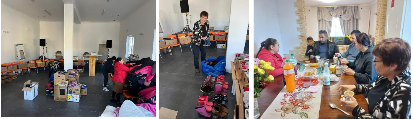
Pakkausurakka oli aikamoinen. Olimme saaneet runsaasti talvitakkeja.

Kysyin, miksi lapsia ei ole ilmoitettu sosiaaliviranomaisille. Vastaukseksi sain, että täällä ei sosiaaliviranomaiset ole samanlaisia kuin Euroopassa. Ymmärsin, että parempi oli asua kotona, vaikkakin käytännössä ilman huoltajaa, kuin asua lastenkodissa. Olin jo muualta kuullut hurjia tarinoita internaattien lapsista, joten en voinut muuta kuin jättää asian Jumalan käteen ja auttaa miten vain on mahdollista. Eilen, kun pakkasimme tavaroita, teimme ison paketin lapsille petivaatteista ulkovaatteisiin.